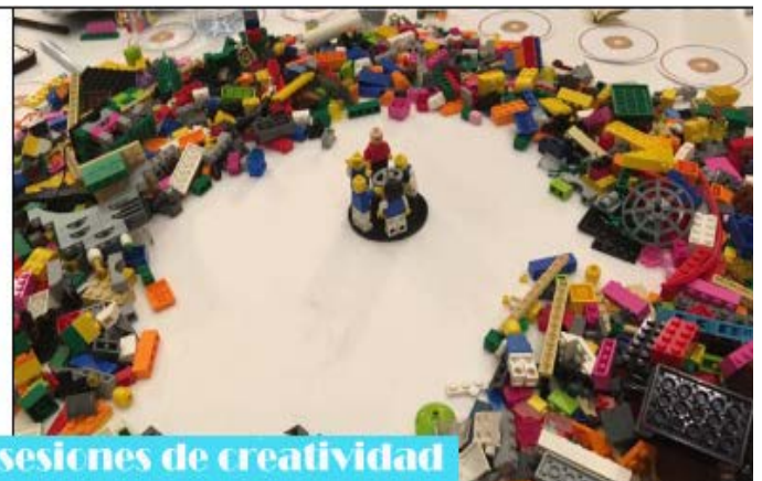
Talleres de debate y sesiones de creatividad